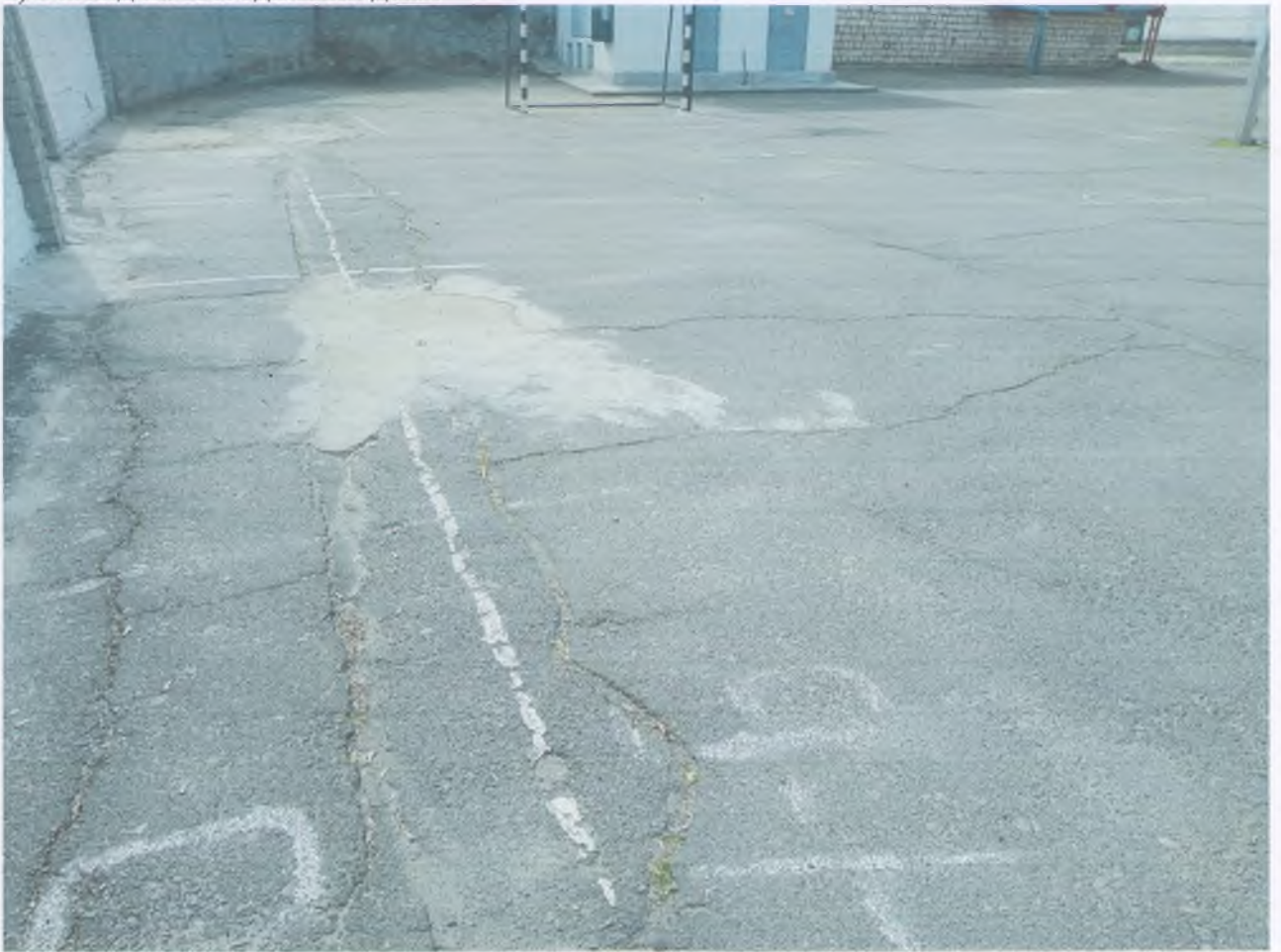
а) Вигляд на сьогоднішній день.