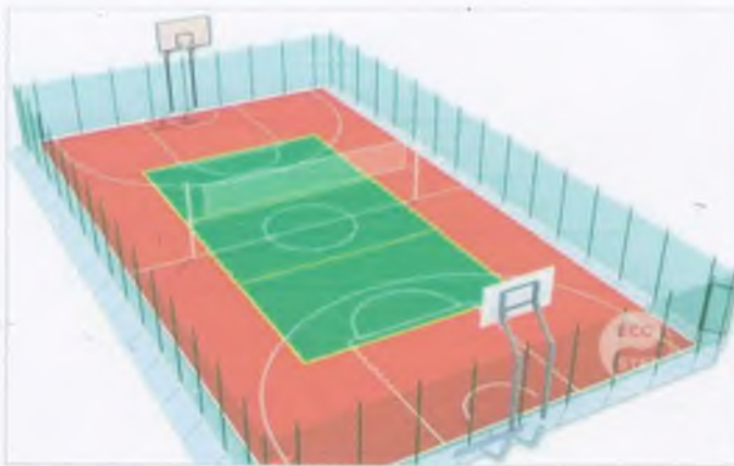
Місця для відпочинку