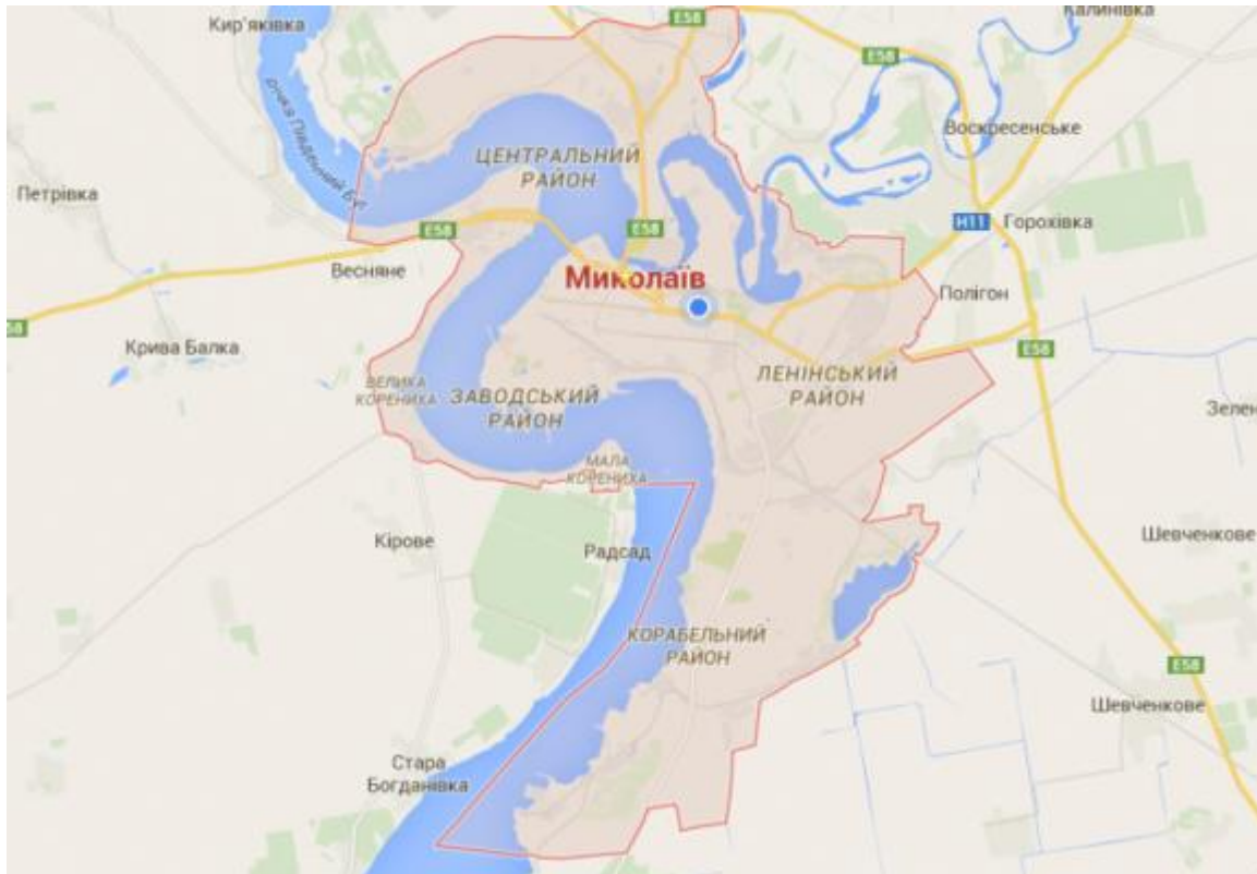
Рисунок 2.1 – карта міста Миколаїв

Місто Миколаїв - місто в Україні, обласний центр Миколаївської області, центр Вітовського і Миколаївського районів. Миколаїв розташований в Північному Причорномор'ї в гирлі річки Інгул, де вона впадає до Південного Бугу, за 65 кілометрів від Чорного моря. Це потужний політичний, діловий, індустріальний, науково-технічний, транспортний та культурний центр. Площа міста за даними головного управління статистики в Миколаївській області станом на складає 259,8 км 2 .