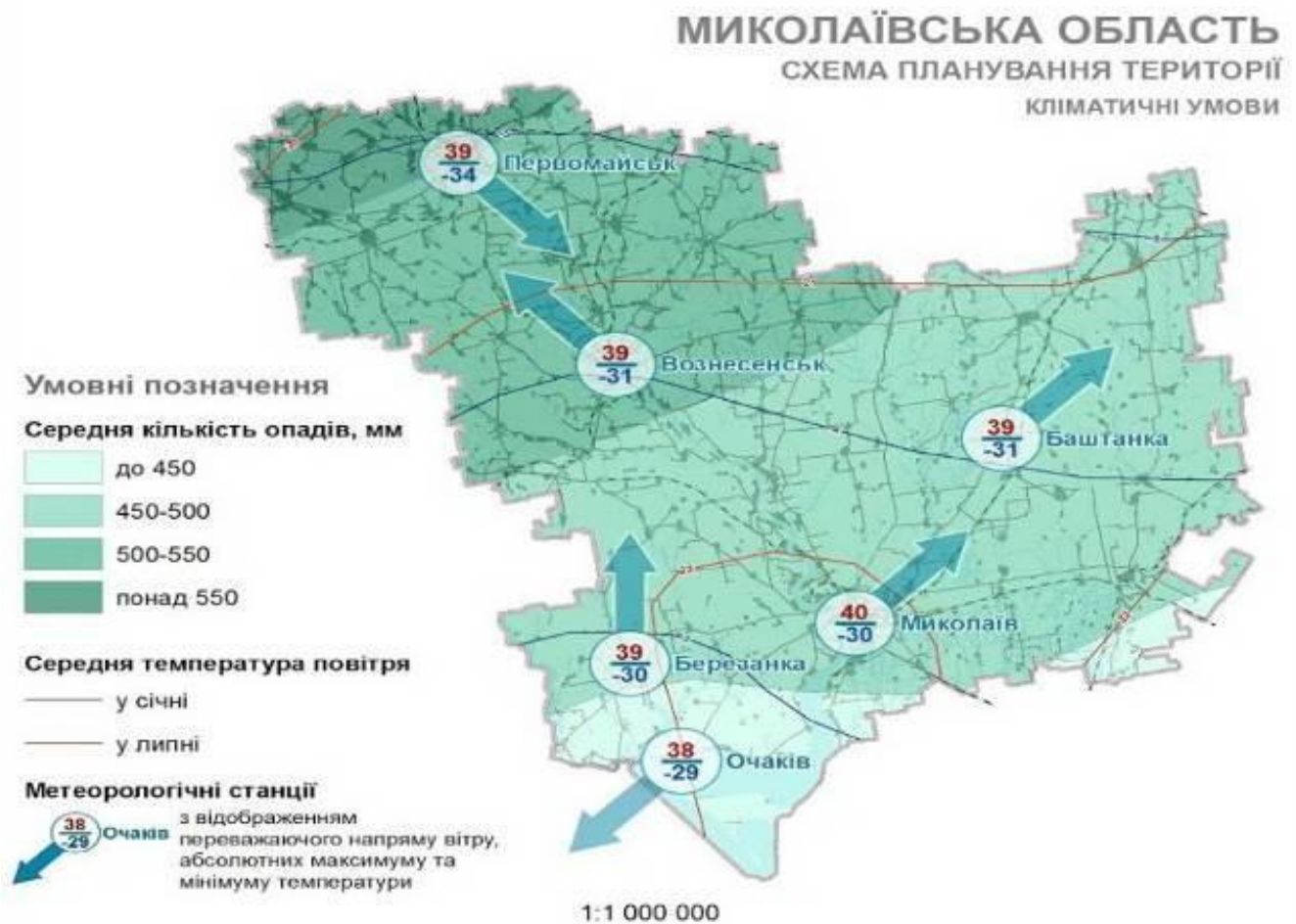
Рисунок 2.3 – Кліматичні умови Миколаївської області Переважаючі напрями вітрів у місті Миколаєві є північно-східні.